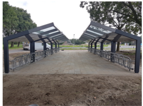
Linker afbeelding: halte Leiderdorp Rietschans. Rechter afbeelding: fietsenstalling R-nethalte Rijnstaterwoude.