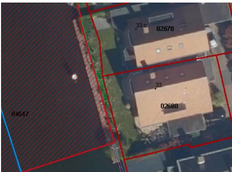
foto 2. Het merendeel van het plankier is gelegen in de veiligheidszone

Het plankier is in 2002 geplaatst door de vorige bewoners van de Vierambachtsweg 33. In afwijking van het toen geldende beleid, en middels een beroep op het gelijkheidsbeginsel, is destijds ontheffing verleend tot het maken en hebben van een plankier. Sinds medio 2020 heeft het perceel Vierambachtsweg 33 nieuwe bewoners. Deze hebben op 22 december 2020 een vergunningaanvraag ingediend voor het overnemen en behouden van het plankier.