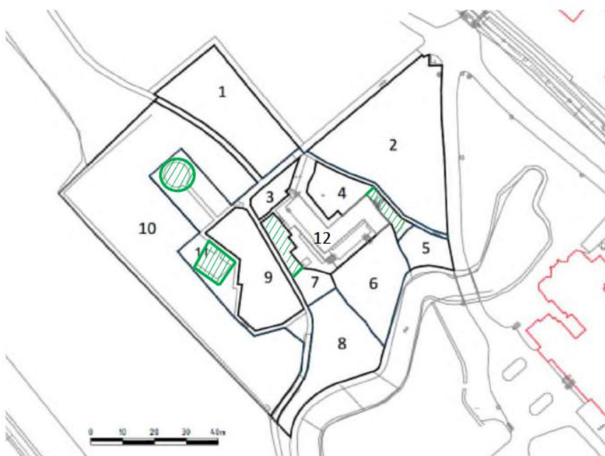
Figuur 1. Ligging Bungalowlocatie met nummering percelen (naar AnteaGroup) De betekenis van de groene markeringen komt aan bod bij de bespreking van de deelgebieden

In aanvulling op de 11 door Antea Group onderscheiden deelgebieden is het centrale deel met de bungalow en direct aangrenzende delen onderscheiden als deelgebied 12.