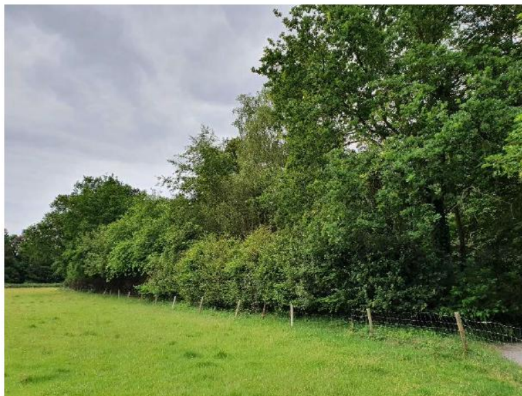
deelgebied 10 gezien vanaf het hooiland

Dit deelgebied kent twee verschillende aspecten. Enerzijds ligt er een tweetal bestrate terrassen met zitgelegenheid, deels omgeven door een goed onderhouden haag. Binnen de grenzen van dit deelgebied lopen verharde paden naar deze terrassen. Anderzijds betreft het bos met in de ondergroei soorten als Klein springzaad, Look-zonder-look, Robertskruid en Geel nagelkruid. Dit bosgedeelte is niet afgescheiden van de omringende bospercelen en vormt daarmee dus een eenheid. De afgrenzing tussen deelgebied 10 en 11 lijkt derhalve willekeurig getrokken en volgt geen infrastructuur of andere afgrenzing. Het wordt niet intensief beheerd. Het intensiever beheerde bestrate deel met haag, ongeveer een derde deel van dit deelgebied, is duidelijk afgescheiden van het omringende bos en is als tuin te beschouwen, het bosgedeelte niet en dat valt daarmee niet onder de exclaveringsregel. De wel als tuin te beschouwen delen (exclusief de paden) van deelgebied 11 zijn in Figuur 1 groen gearceerd. Het als tuin te beschouwen gedeelte valt wel onder de exclaveringsregel.