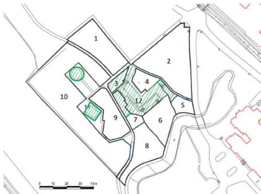
Figuur 2. Groen gearceerd het te exclaveren gedeelte; de eveneens te exclaveren paden zijn niet gearceerd. Inclusief de paden betreft het zo'n 1500 m 2 .

Inclusief de paden komt het te exclaveren oppervlak uit op zo'n 1500 m 2 , minder dan de helft dus van het door Antea Group berekende oppervlak. Het te exclaveren oppervlak valt buiten de begrenzing van het NNN.