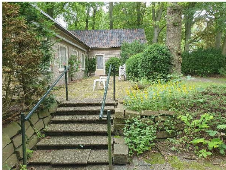
beeld van deelgebied 12 met Bungalow en terras

Dit deelgebied betreft de woning met direct aangrenzende terrasverharding, paden en intensief beheerde borders met tuinplanten. Het is dan ook te beschouwen als een woning met aangrenzende tuin, inclusief bijbehorende verharding. Daarmee valt het onder de exclaveringsregel.