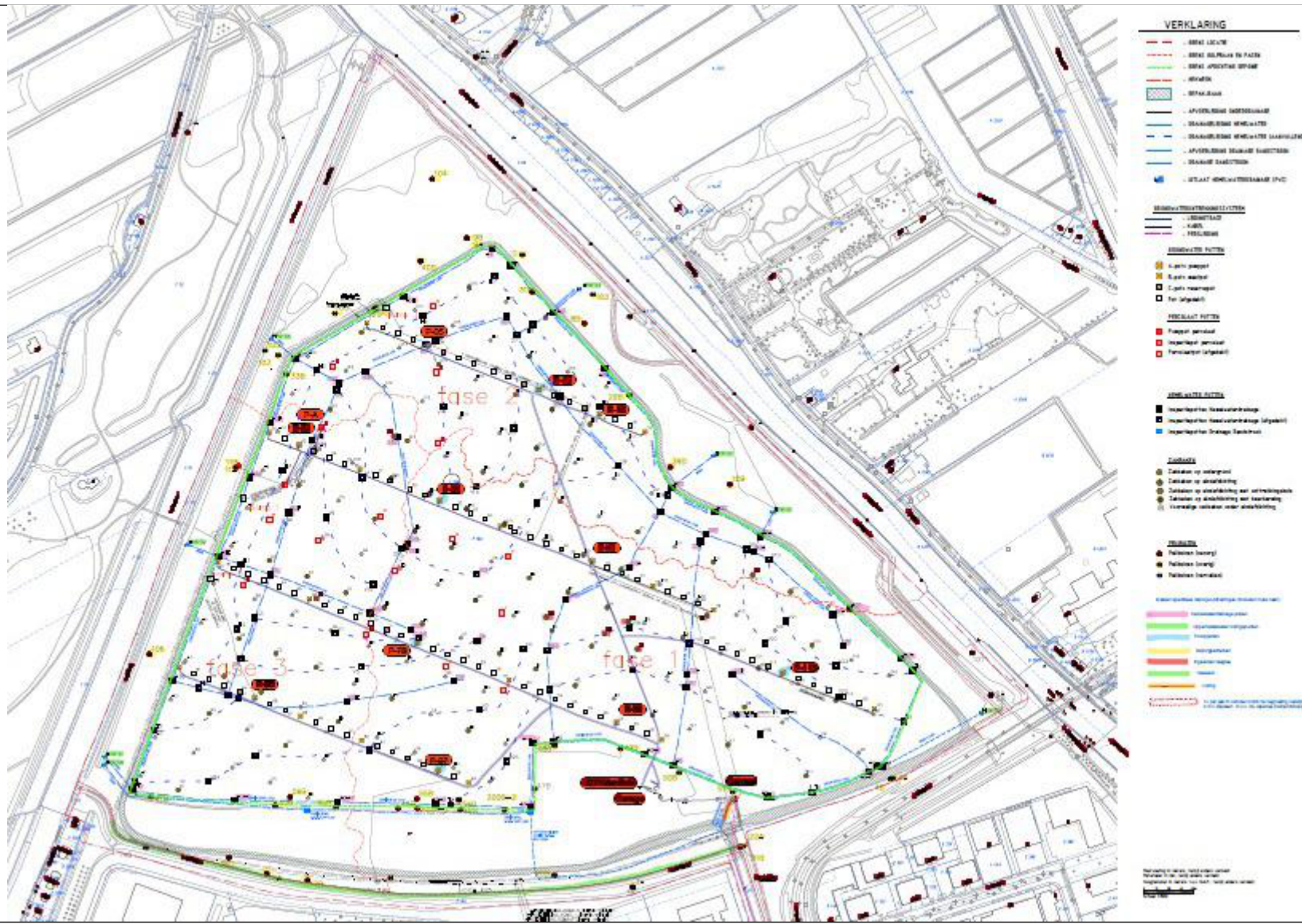
Bijlag e 4

Overzicht nazorgvoorzieningen met statussen: