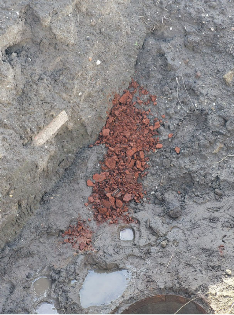
Uitkomend ijzer bij put H10; dit zijn stukjes van ca. 0,5 cm dik en zijn vast materiaal.