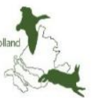
Kaart: leef- en beheergebied damherten in gemeente Hoeksche Waard