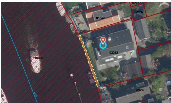
Foto 2. Geel omlijnd: plankier Vierambachtsweg 19. Rood gearceerd: veiligheidszone

Sinds medio 2020 heeft het perceel Vierambachtsweg 19 nieuwe bewoners. Deze hebben op 12 december 2020 een vergunningaanvraag ingediend voor het overnemen en behouden van het plankier.