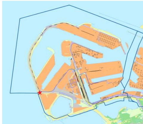
Afbeelding 2: Veiligheidscontour met gewenste locatie Havenervaringscentrum