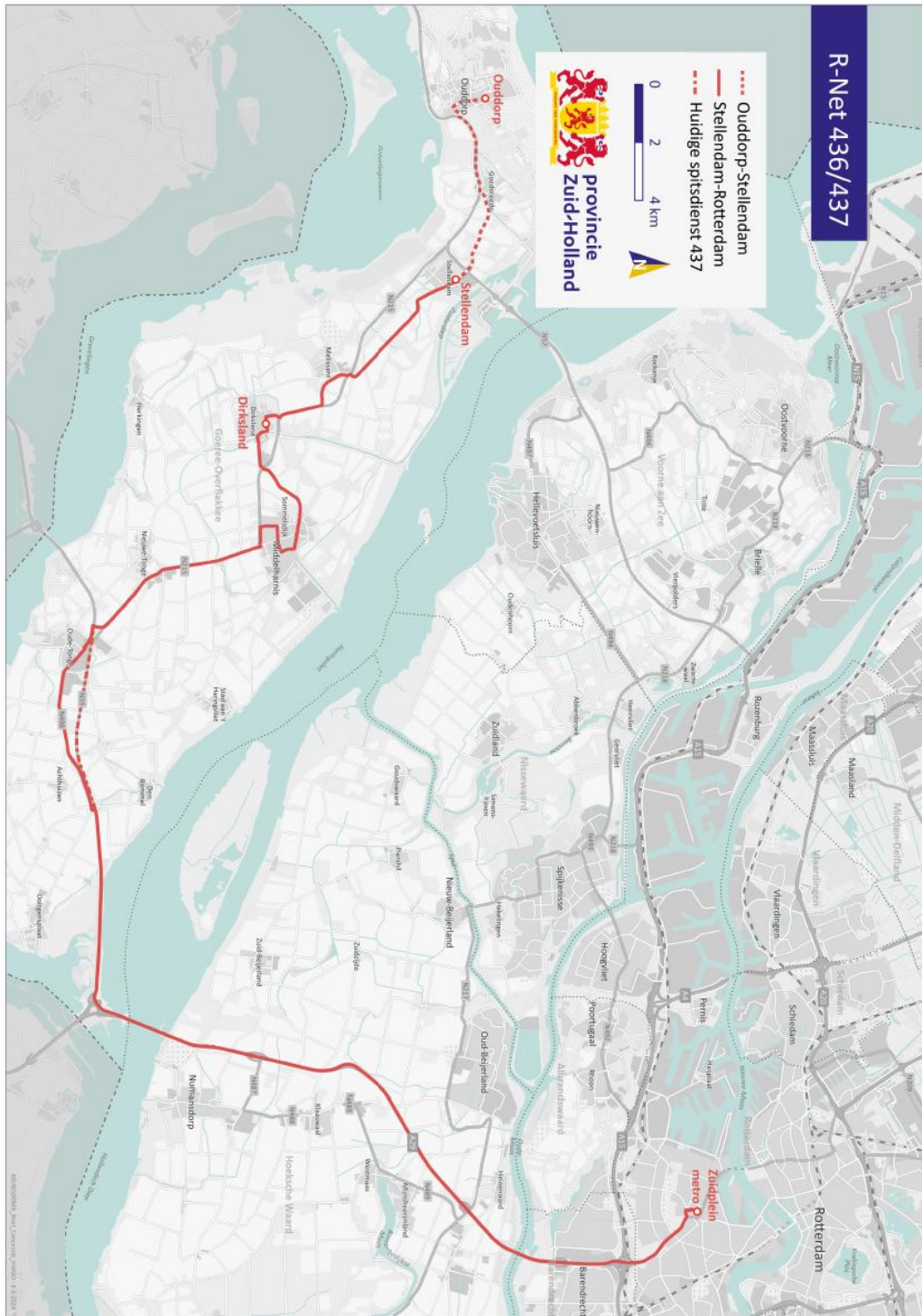
Kaartbeeld R-net-Corridor Rotterdam Zuidplein – Stellendam (– Ouddorp) op basis van de Dienstregeling 2023.