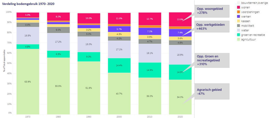
Figuur 2 - Ontwikkeling van het bodemgebruik door de jaren heen - Bron: Toekomstonderzoek 50-50 Provincie Zuid-Holland