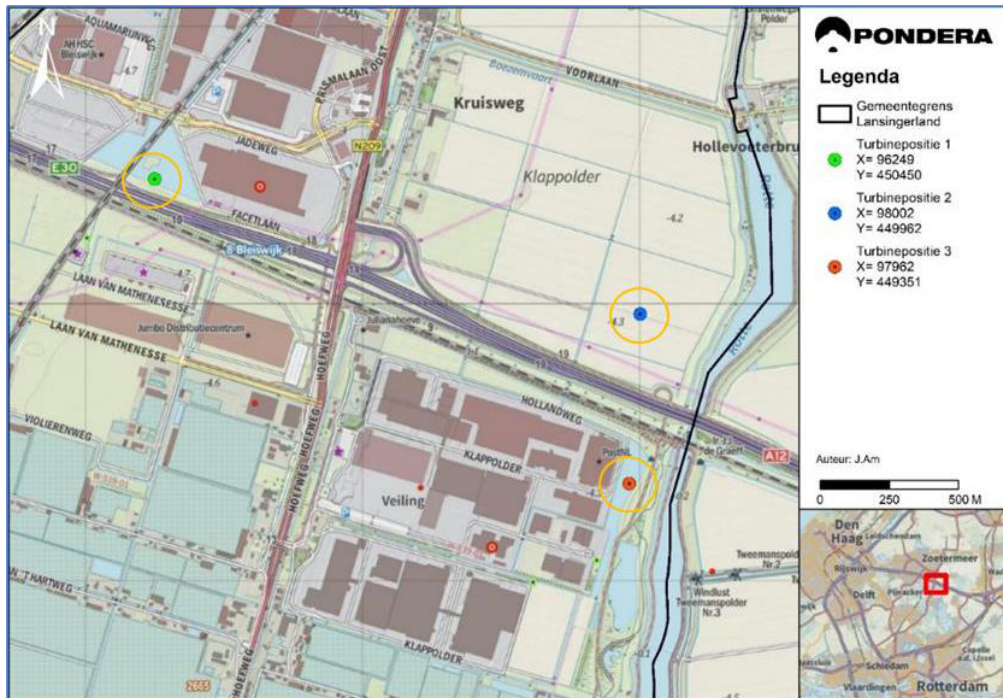
Figuur 1 : Turbineposities alternatieve locaties windenergie Bleizo

De verkenning laat zien dat er zowel landschappelijke als technische bezwaren zijn in het realiseren van windenergie op de locatie Prisma/Bleizo. De landschappelijke bezwaren betreffen onder meer het niet kunnen behalen van een lijn- of clusteropstelling. De technische bezwaren betreffen onder meer het voldoen aan regels voor externe veiligheid en de te beperkte ruimte voor realisatie en onderhoud. Ook voor de alternatieve turbineposities 1 en 3 worden deze landschappelijke en technische bezwaren gezien.