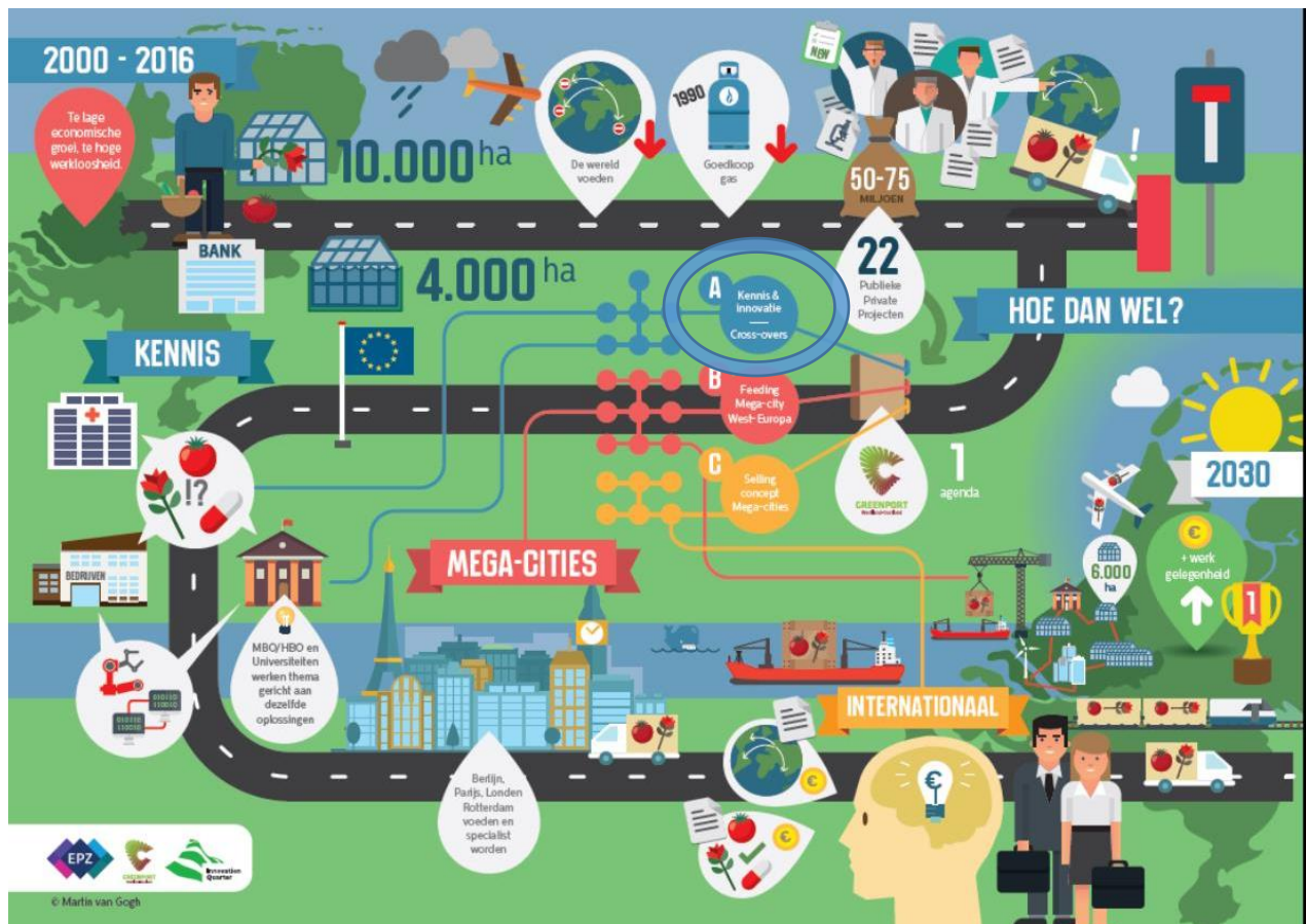
Figuur 1 Grafische weergave van de positionering van de ambities van het Innovatiepact Feeding & Greening Megacities van Greenport West-Holland: A Kennis & Innovatie – cross-overs (Gogh, 2016).

Greenport West-Holland heeft het initiatief genomen om deze ambitie tot uitvoering te brengen in een bredere samenwerking (verder genoemd Innovatiepact of het pact).