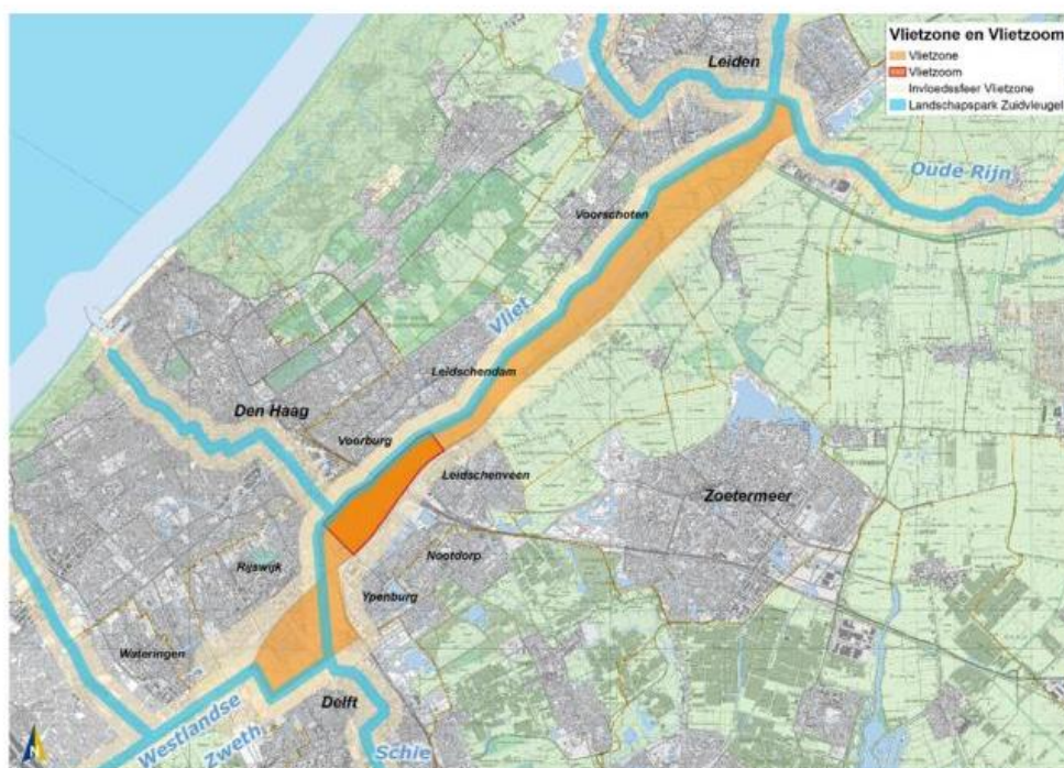
Figuur 1, ligging van de Vlietzone