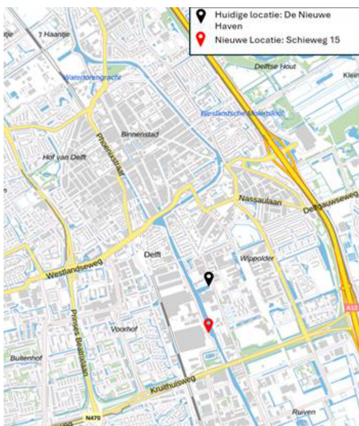
Afbeelding 1: Overzichtskaart huidige en nieuwe locatie

De verhuizing van LAGA heeft als gevolg dat schepen met een (tijdelijke) ligplaatsvergunning de Nieuwe Haven moeten verlaten, met uitzondering van de schepen van waterscouting Nautilus. Thor, een rugbyvereniging met een schip dat dient als clubhuis, zal ook uit de Nieuwe Haven moeten vertrekken. De gemeente Delft heeft samen met Thor naar een nieuwe locatie gezocht, maar er is nog geen definitieve oplossing gevonden die op korte termijn beschikbaar is.