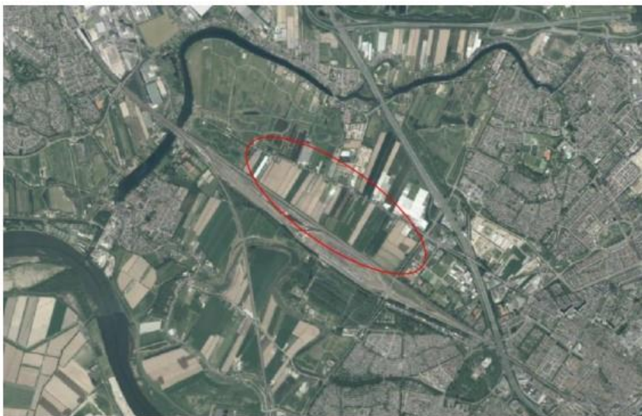
Afbeelding 1: Luchtfoto met ligging plangebied

Het plangebied ligt in de Zwijndrechtse Waard tussen het rangeerterrein Kijfhoek en de Langeweg, ten westen van de Munnikensteeg (stadsrand Zwijndrecht). Onderstaand beeldmateriaal geeft een indruk van de huidige ruimtelijke en functionele situatie. Er zijn nu akkers, enkele kassen en een boomgaard. Het plangebied ligt in het zoekgebied zon Kijfhoek van de RES1.0 Drechtsteden (vastgesteld in PS 14 juli 2021).