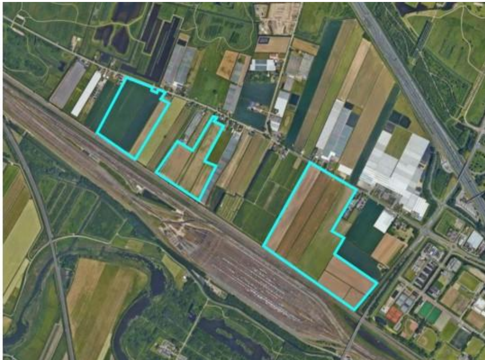
Afbeelding 2: begrenzingen deelgebieden

In de Regionale Energie Strategie Drechtsteden is een uitwerkingsgebied ten behoeve van zonne-energie opgenomen. Na de uitvraag van de gemeente Zwijndrecht hebben Drechtse Energie, Novar en Eneco zich samen gemeld om het uitwerkingsgebied te ontwikkelen. Dit heeft geleid tot onderstaand plan. In afbeelding 2 is het specifieke plangebied aangegeven op de luchtfoto van de actuele situatie. Het plangebied bestaat uit drie separate gebieden.