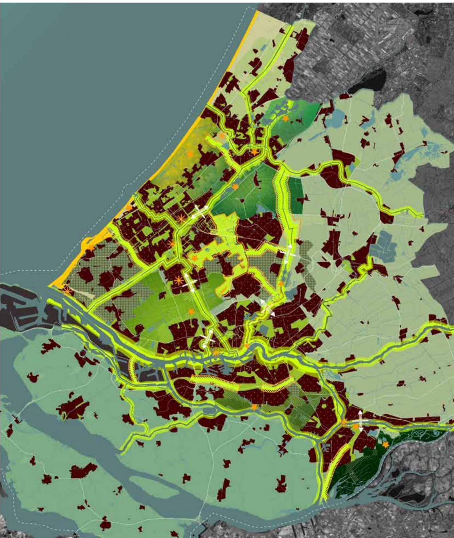
Landschapspark Zuidvleugel (uit 'Verkenning stedelijk landschap en groenblauwe structuur Zuid-Holland', Marco Broekman c.s.