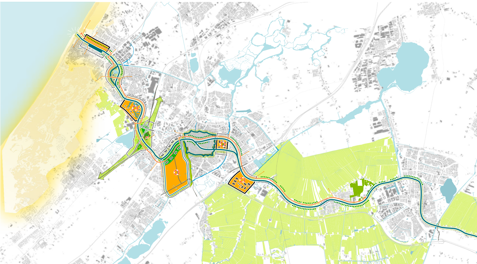
Projectenkaart Oude Rijn (uit 'Verslag kwartiermakersfase Landschapspark Zuidvleugel', Defacto)