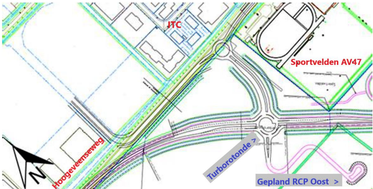
Figuur 3.4, uit Provinciaal Inpassingsplan N207 Zuid

In het Provinciaal Inpassingsplan (PIP) N207 Zuid is van aanvang af ingetekend een Recreatie Concentratiepunt (RCP) aan de westzijde van de N207 Zuid bij Boskoop (RCP-oost).