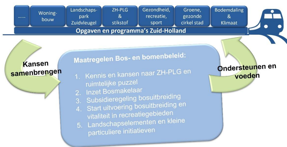
Figuur 1. Acties Bos- en bomenbeleid om kansen in beeld te krijgen en "de rijdende trein" van opgaven en programma's te voeden en ondersteunen

De afgelopen twee jaar is hier een start meegemaakt en voorstel is om dit de komende jaren voort te zetten. In onderstaande figuur is weergegeven welke maatregelen de komende periode vanuit het bos- en bomenbeleid genomen worden om kansen samen te brengen en diverse opgaven en programma's te ondersteunen en te inspireren.