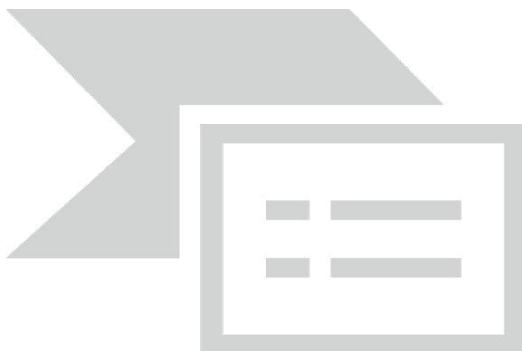
Figuur 2. Uitsnede Verlengde Bentwoudlaan ter hoogte van het Bentwoud.

De portefeuillehouder verkeer vraagt GS een afweging te maken tussen energietransitie en ruimtelijke kwaliteit. De portefeuillehouder stelt voor om het plaatsen van zonnepanelen op de oostelijke grondwal in de volgende versie van het PIP planologisch mogelijk te maken. Dit is aan de kant van Boskoop en Waddinxveen. Hierdoor zal het voor een exploitant in de toekomst mogelijk worden daar zonnepanelen te realiseren. Vanuit het project onderzoeken wij de mogelijkheid om zonnepanelen te integreren in een geluidsscherm naast de Bentwoudlaan bij de nieuwbouwwijk 't Suyt.