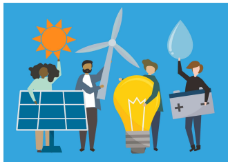
Duurzaamheid: energie, circulariteit