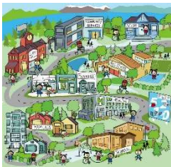
Wonen: leefbaarheid, voorzieningen