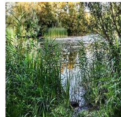
Groen en water: natuur, recreatie, cultuurhistorie