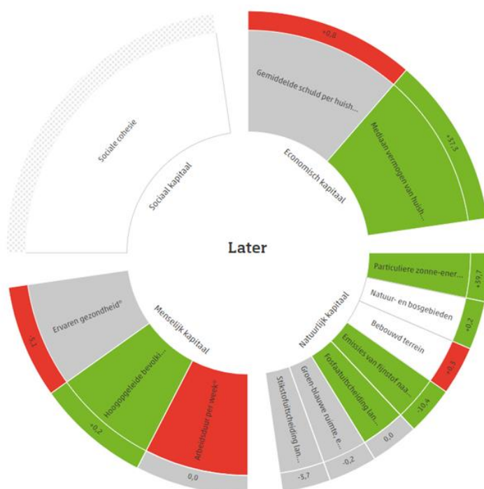
Figuur 2 Trends 'later' Regionale monitor Brede Welvaart 2023 van het CBS