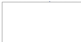
Bestuurlijk trekker Bouwstroom Haaglanden