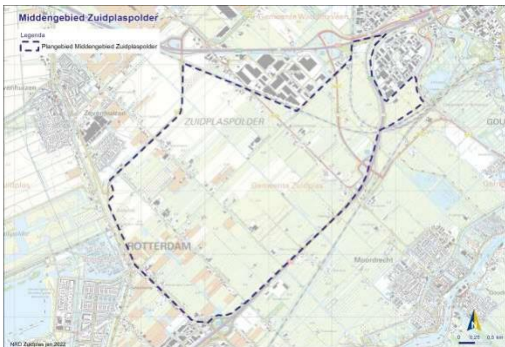
Figuur 1: kaart Middengebied

De samenstelling en de werkwijze van de werkgroep van de Commissie en verdere projectgegevens staan in bijlage 1 van dit advies. U vindt de projectstukken die bij het advies zijn gebruikt door nummer 3613 op www.commissiemer.nl in te vullen in het zoekvak.