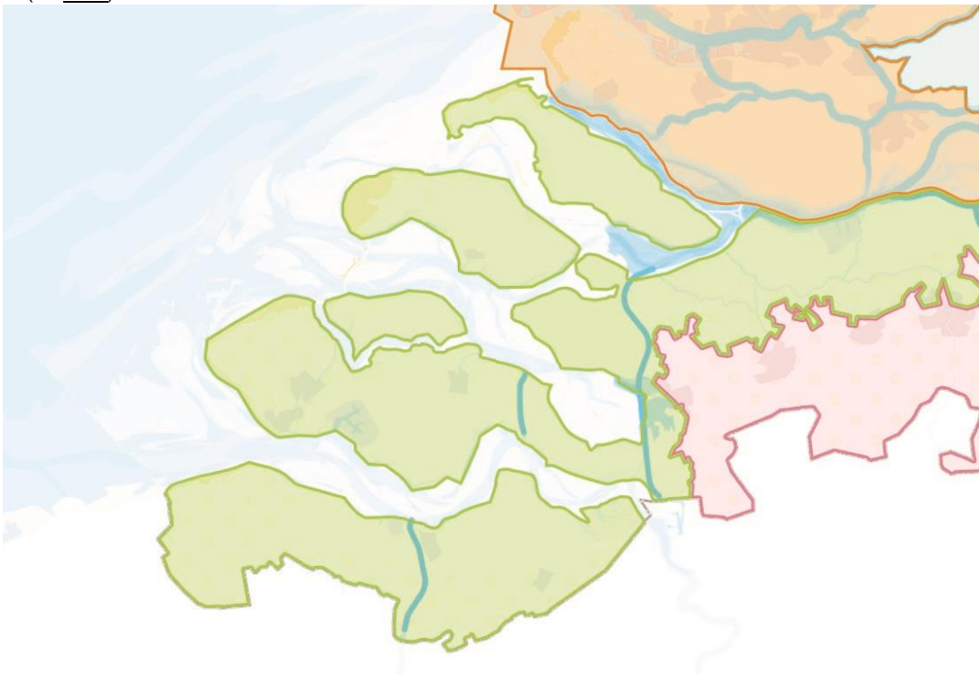
Figuur 2: kaart met begrenzing van het Deltaprogramma Zuidwestelijke Delta