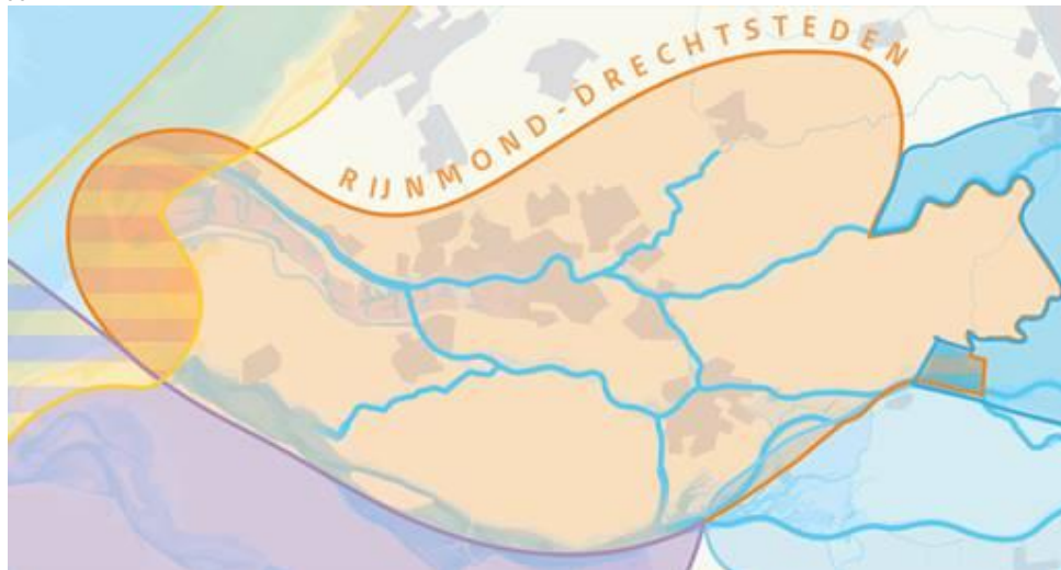
Figuur 3: werkgebied deltaprogramma Rijnmond-Drechtsteden