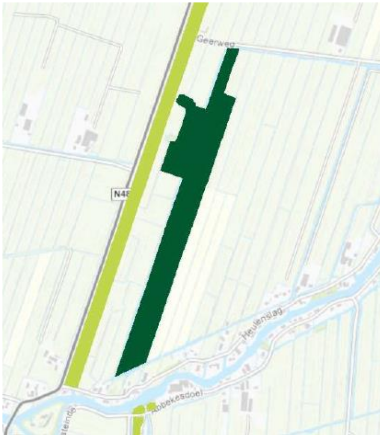
Fig. 12 Ecologische verbindingzone Zijdeweg:

Het donkergroene gebied is opengesteld voor functieverandering en inrichting.