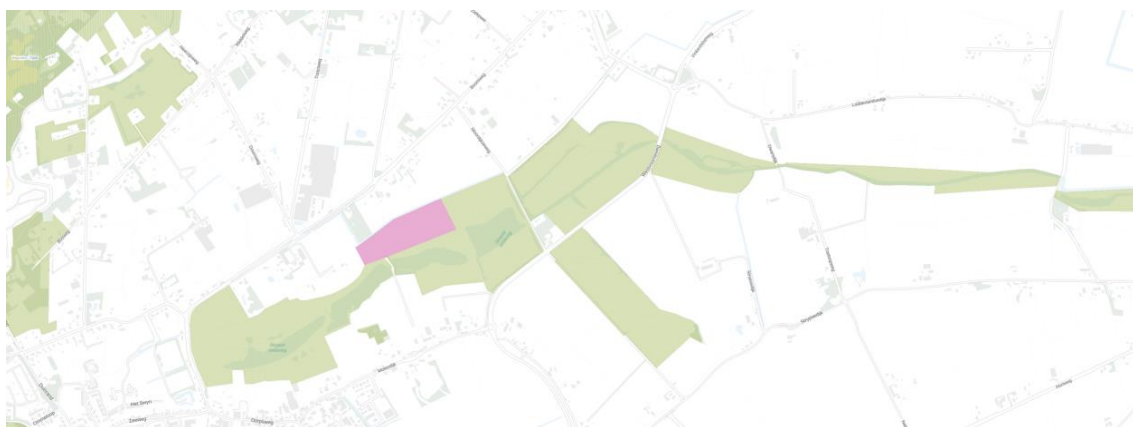
Fig. 11 Strypse Wetering

Het rood omlijnde gebied is opengesteld voor functieverandering en inrichting.