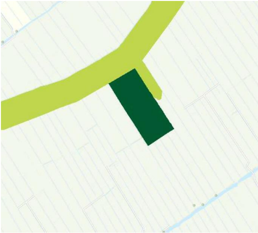
Fig. 13 Ecologische verbindingszone Brandwijk:

Het donkergroene gebied is opengesteld voor functieverandering en inrichting.