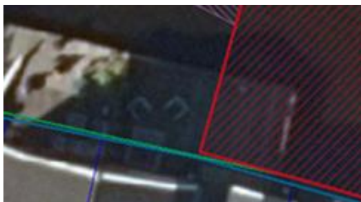
foto 2. een deel van de steiger gelegen in de veiligheidszone

Medio 2018 is deze steiger geplaatst door de vorige bewoners van Hoorn 46. Deze bewoners hebben een aanvraag om een ontheffing ingediend om deze situatie te legaliseren, maar deze aanvraag is vanwege de discussie over de veiligheidszone vervolgens niet afgewikkeld. Sinds medio 2020 heeft het perceel Hoorn 46 nieuwe bewoners. Deze hebben op 7 oktober 2020 een vergunningaanvraag ingediend voor het overnemen en behouden van deze steiger.