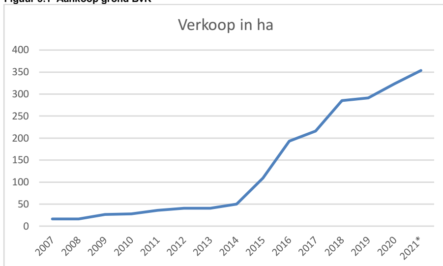
Figuur 5.1 Aankoop grond BvR