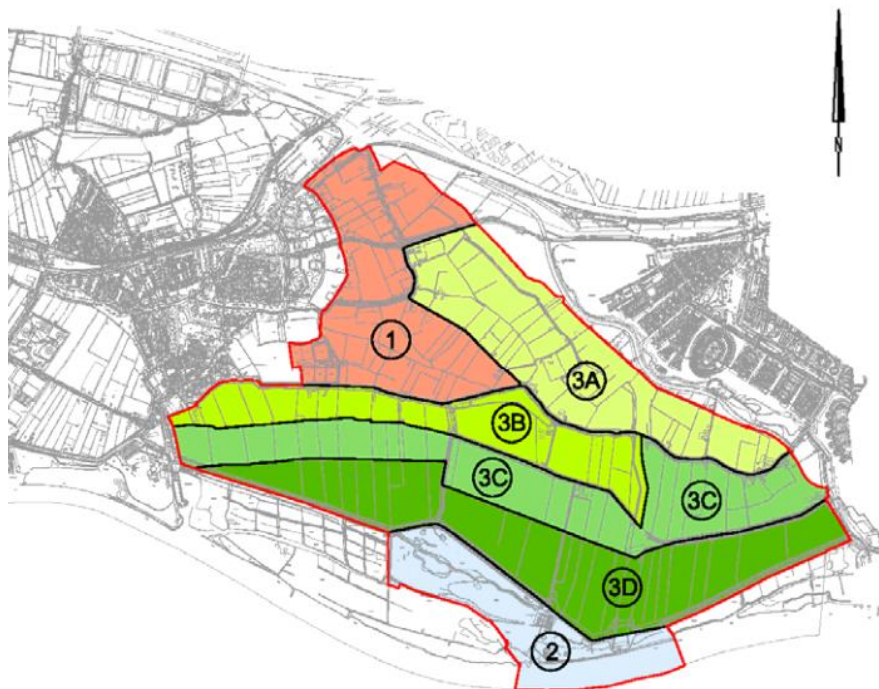
Figuur 2.3 Deelgebieden Buitenland van Rhooon conform bestemmingsplan uit 2012