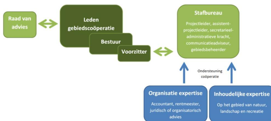
Figuur C.1 Organogram Buitenland van Rhoon