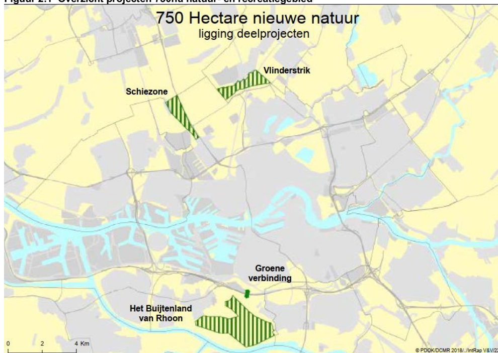
Figuur 2.1 Overzicht projecten 750ha natuur- en recreatiegebied