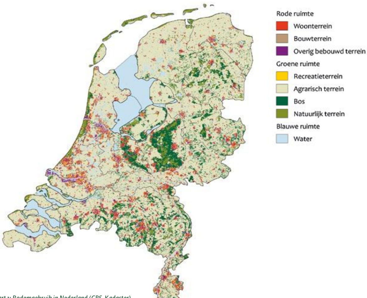
Kaart 1: Bodemgebruik in Nederland (CBS, Kadaster)

Maar soms moeten we andere keuzes maken, om bijvoorbeeld de veiligheid te borgen of om ruimte te creëren voor nieuwe woningen. In het reguliere beheer worden bomen gekapt voor verjonging en productie (zie het thema 'Vitaal bos'). Ook is het soms nodig om bos om te vormen naar andere typen natuur. Dat komt omdat het in Nederland slecht is gesteld met de plant- en diersoorten die afhankelijk zijn van open landschappen, zoals heide. Dit komt vooral door de hoge stikstofneerslag. We blijven daarom de herstelmaatregelen voor deze kwetsbare natuur uitvoeren.