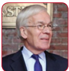
Herman Tjeenk Willink* – Oud voorzitter Eerste Kamer / oud vicepresident van de Raad van State / informateur van het huidige kabinet.