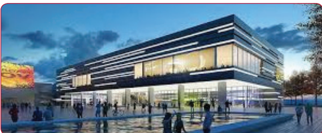
De module vindt plaats in Hart van Zuid te Rotterdam