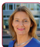
Jeannette Baljieu Gedeputeerde provincie Zuid-Holland