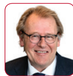
Jaap Smit – Commissaris van de Koning