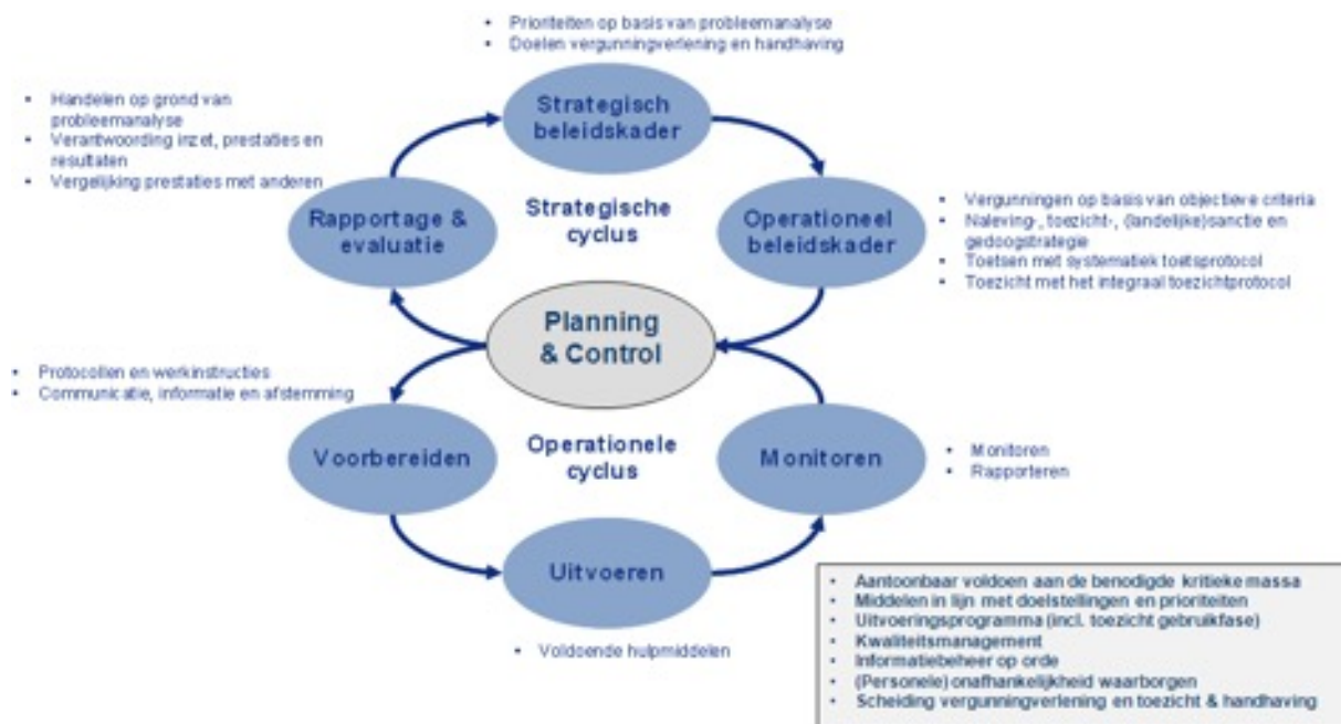
Figuur 1: de gesloten beleids- en uitvoeringscyclus conform de BIG 8

Van de kwaliteitscriteria kan gemotiveerd worden afgeweken als de kwaliteitscriteria niet zijn of konden worden nageleefd. Dit gebeurt middels een rapportage en verbeterplannen, gericht aan het dagelijks- en algemeen bestuur van de omgevingsdiensten.