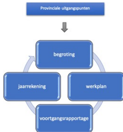
Figuur 2: planning & control-cyclus jaarprogramma omgevingsdiensten.

Het onderstaande figuur schetst de jaarlijkse planning & control-cyclus. Het werkplan van de omgevingsdiensten voldoet aan de provinciale uitgangspunten en past binnen de begroting. Na vaststelling voert de omgevingsdienst het werkplan uit, waarbij de provincie voortgangsrapportages ontvangt. Wanneer nodig kan de provincie bijsturen.