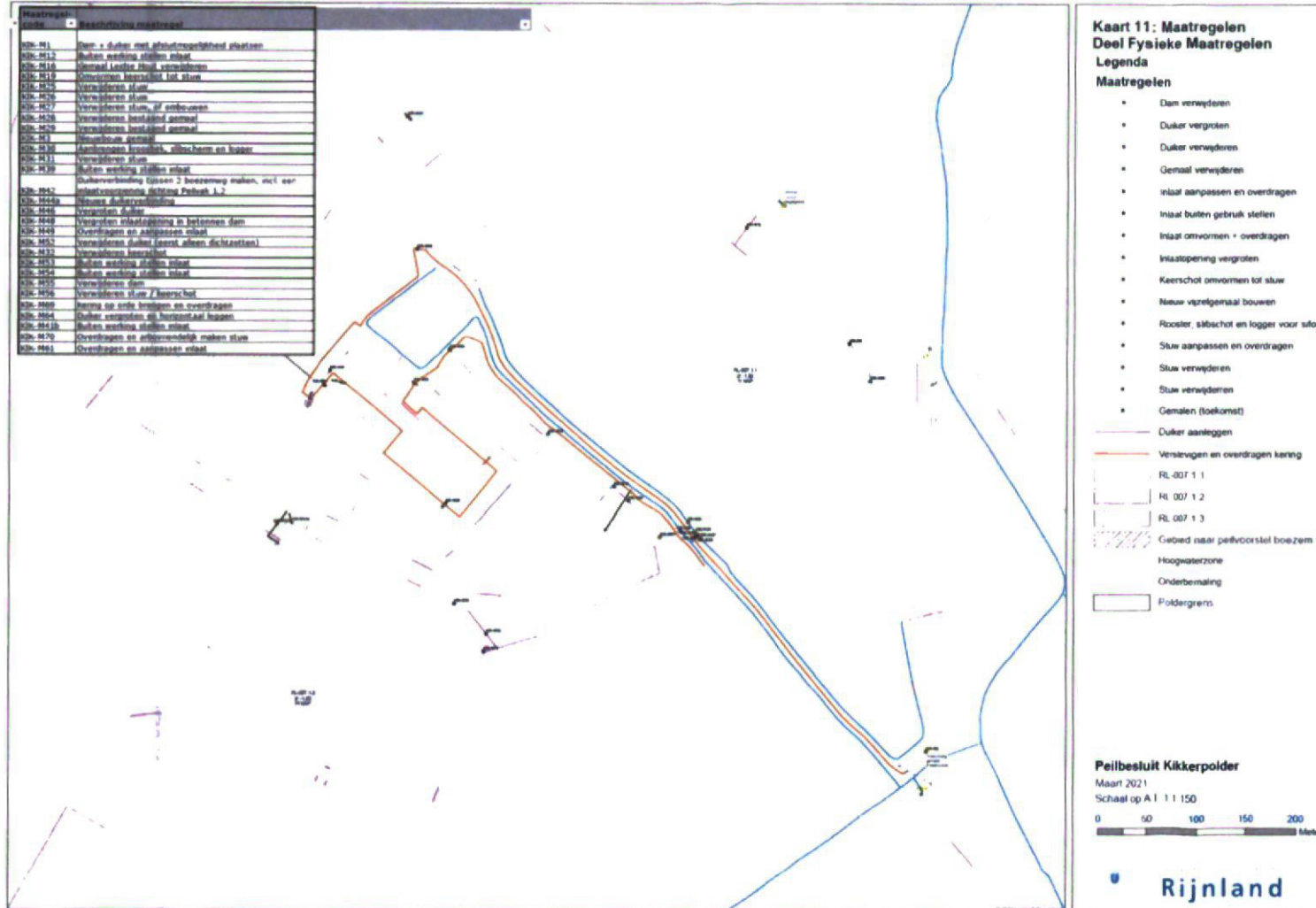
Bijlage 4; Kaart 11 Fysieke en niet fysieke maatregelen.