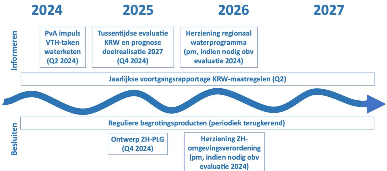
Figuur 2: Tijdlijn met belangrijke momenten van informatievoorziening aan en besluitvorming door Provinciale Staten.